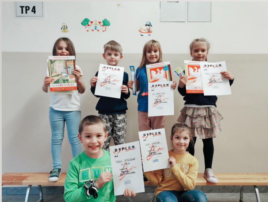
KONKURS PIOSENKI PATRIOTYCZNEJ