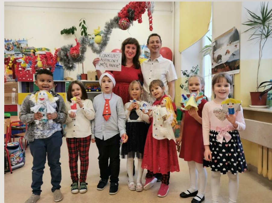
KONKURS „ŚWIĄTECZNY ANIOŁ”